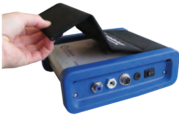
inklusive praktischer Schutzhülle