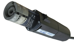
ESG Plus 2