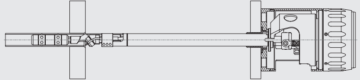
Innenbrenner: Zum Schweißen von zurück- gesetzten Rohren und Hinter- boden-Anwendungen